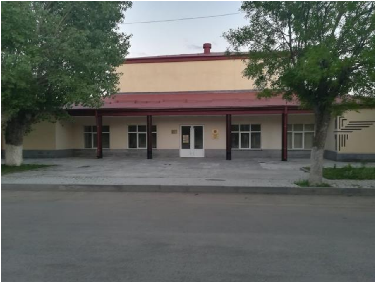
ԱՄԱՍԻԱՅԻ ՄԱՐԶԱՄՇԱԿՈՒԹԱՅԻՆ ԿԵՆՏՐՈՆ