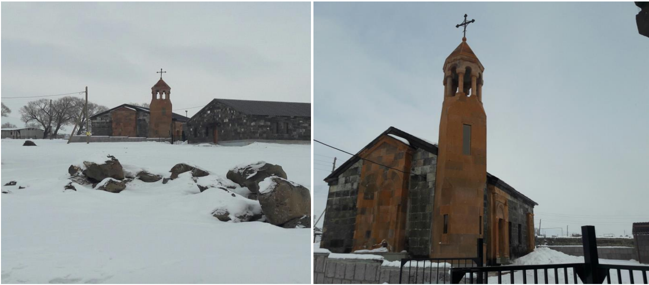
Բանդիվանի Սբ. Աստվածածին եկեղեցի, կառ.1909թ. (վերանորոգվել է 2016)

Համայնքի մշակութային հաստատություններն են՝ Ամասիայի համայնքային կենտրոնը, Ամասիայի մարզահամերգային կենտրոնը, Ամասիայի արվեստի դպրոցը, Գտաշենի մշակույթի տունը, որը վերանորոգման կարիք ունի: