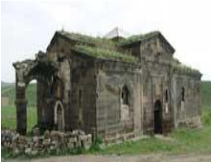
Գտաշենի Սբ. Կարապետ եկեղեցի Մեղրաշատի եկեղեցի (վերանորոգվել է 2015թ)